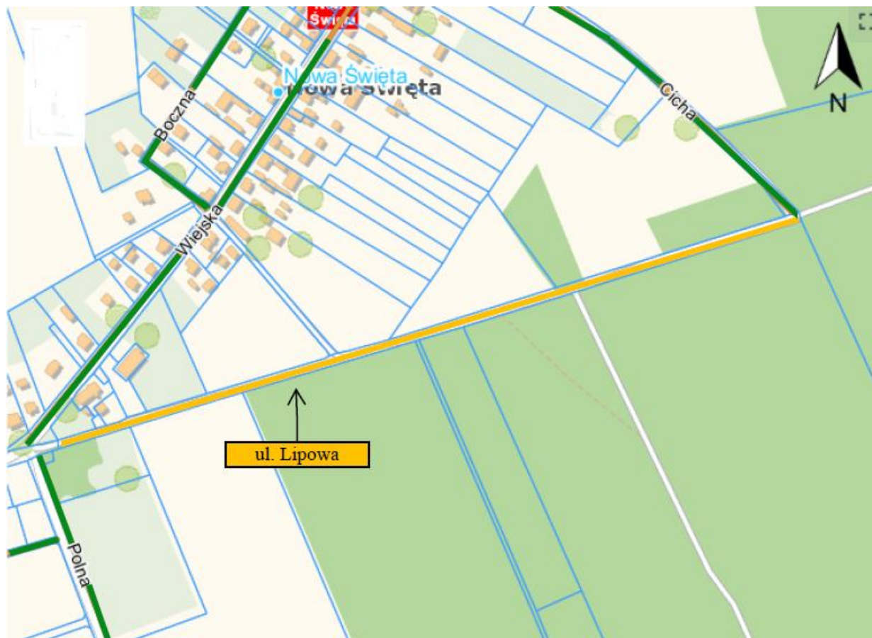
położenie ulicy zaznaczono na mapie kolorem pomarańczowym